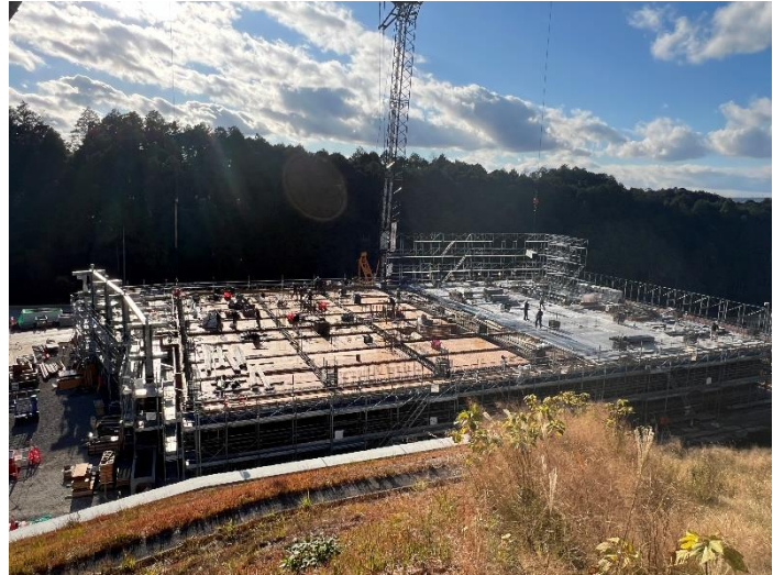
【コンクリート打設後の状況】