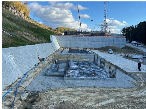
【車庫棟、訓練棟の状況】